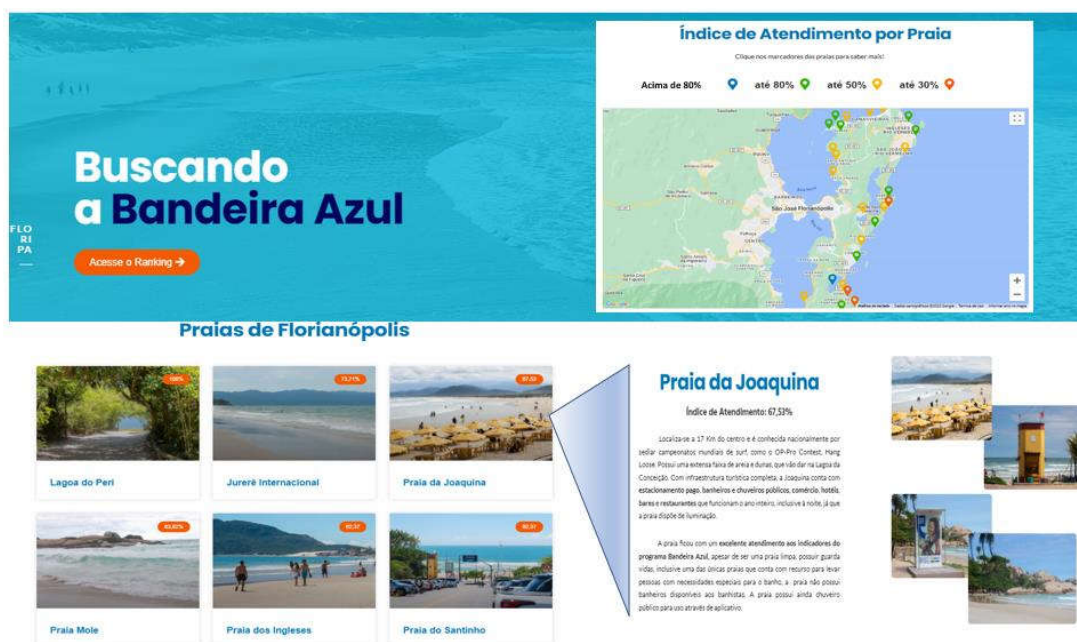
Figura 14 – Site: Buscando a Bandeira Azul – Florianópolis (local onde esta disponibilizado os resultados da pesquisa)