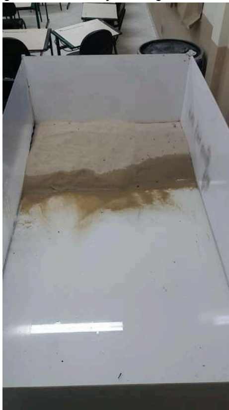
Figura 40 – Colocação de água no modelo