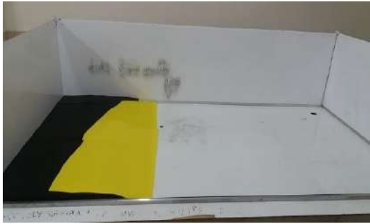
Figura 38 – Base com material acetinado