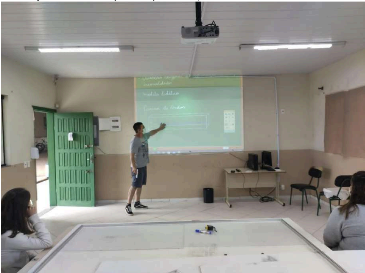
Figura 35 – Demonstração do Projeto de Pesquisa aos estudantes do Ensino Médio

Inicialmente, foi realizada uma apresentação do projeto de pesquisa, onde os estudantes tiveram uma pequena explanação do objetivo proposto, como é possível observar na figura 35. Com a ajuda dos estudantes, o modelo será aplicado em atividades didáticas, propondo atividades para explicar conceitos teóricos com modelos práticos nas aulas do Ensino Médio regular da unidade escolar.