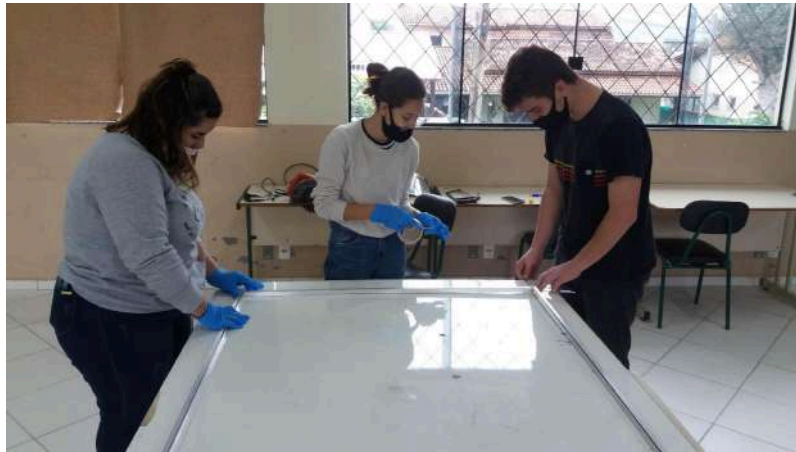
Figura 36 – Estudantes elaborando as dimensões do modelo

largura por 2 (dois) metros de comprimento, propiciando assim uma maior pista para a formação de ondas, como observa-se na figura 36.