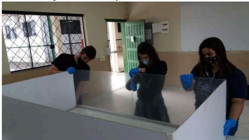
Figura 37 – Colocação do acrílico no modelo

Uma etapa muito importante da confecção do modelo é a colocação de um acrílico transparente na parte frontal da maquete, ilustrada na figura 37, a fim de visualizar a formação, o deslocamento e o tamanho da onda, além do impacto que ela provoca ao interagir com o relevo.