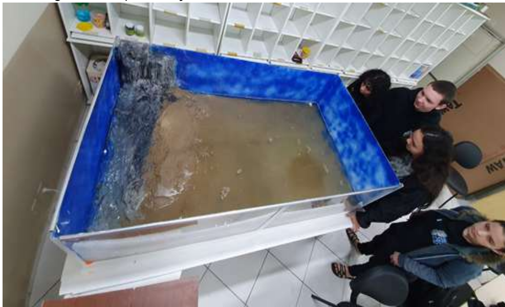
Figura 42 – Apresentação do modelo aos estudantes do ensino médio

A ideia é realizar algumas aulas expositivas para que seja possível desenvolver teorias científicas de forma prática com os estudantes.